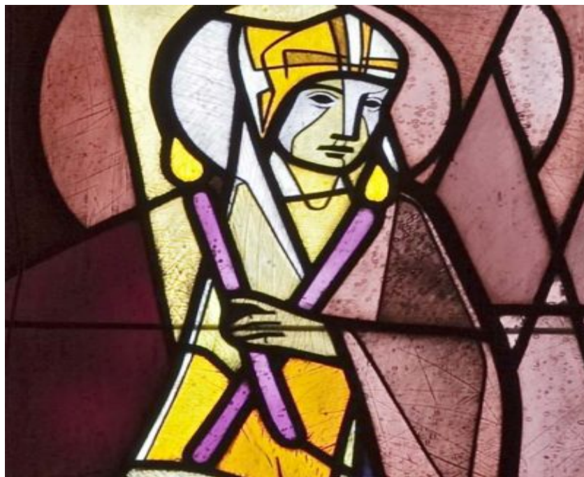
Fotonachweis: Segnender Bischof Blasius, Glasfenster St. Elisabeth, Osnabrück