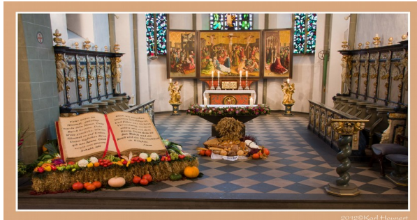
Erntedank in der St Laurentius Kirche Clarholz

Erntedank bedeutet zunächst einmal "Dank feiern". Deshalb finden einmal im Jahr die reichen Gaben der Natur ihren Weg in die christlichen Kirchen. Der Altar ist dann mit farbenfrohen Arrangements an Äpfeln, Kürbissen und Brot geschmückt. Aber warum? Den Termin am ersten Sonntag im Oktober hat die Deutsche Bischofskonferenz erst 1972 festgelegt. Daraus folgt für die einzelnen Gemeinden aber keine Pflicht, an diesem Tag zu feiern – es ist An Erntedank Gott für die und zeigen, Abhängigkeit