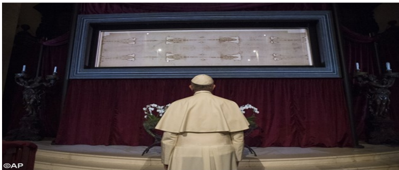
Papst Franziskus betet vor dem Turiner Grabtuch

Auch Papst Franziskus besuchte das Grabtuch am 21. Juni 2015 in Turin, um davor zu beten.